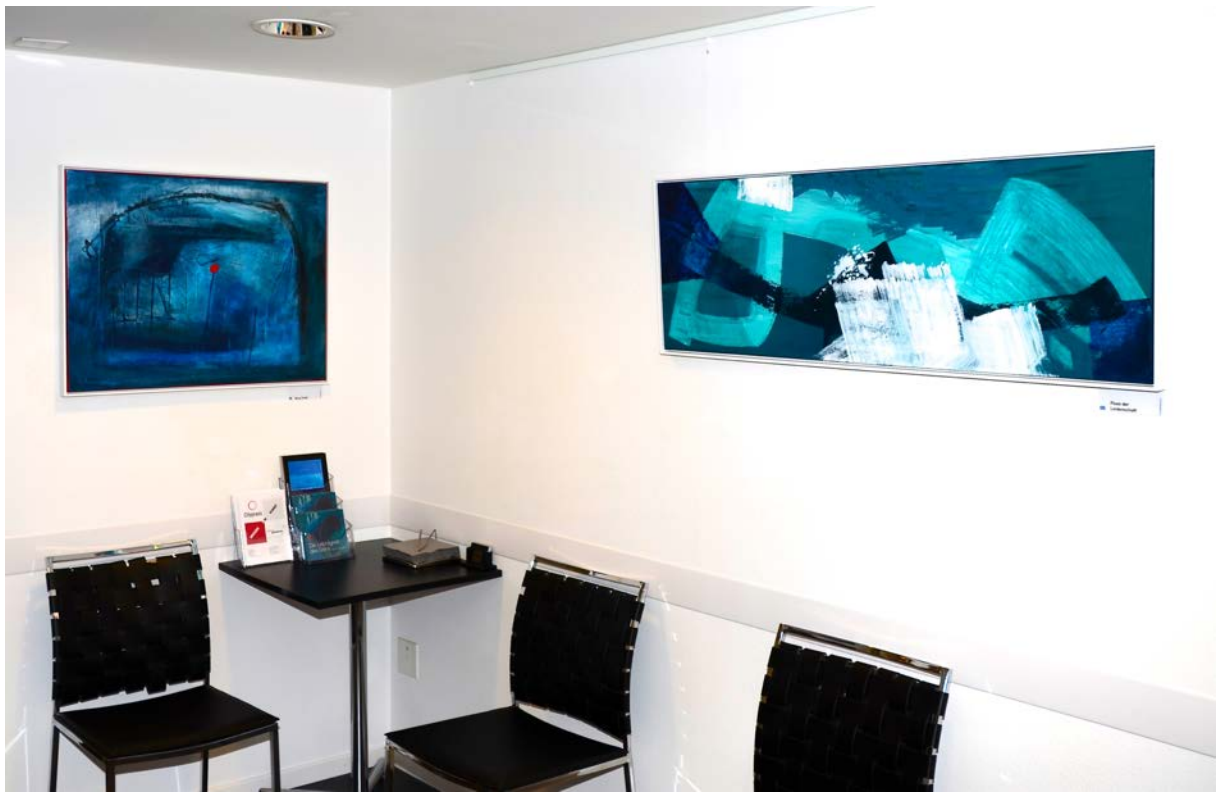
Warteraum / Wartezimmer