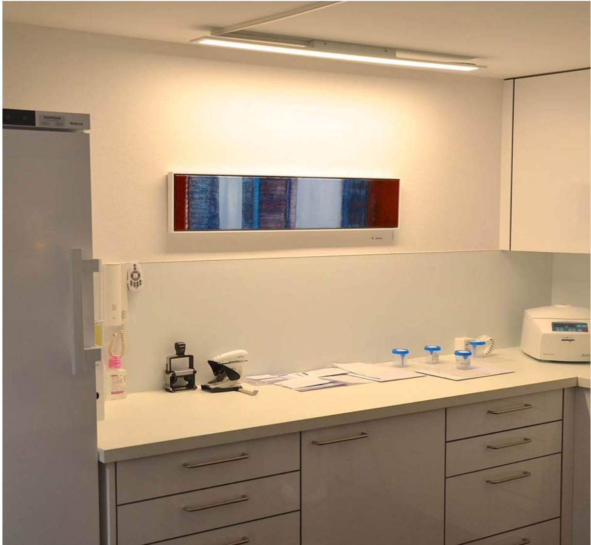
Empfang / Labor