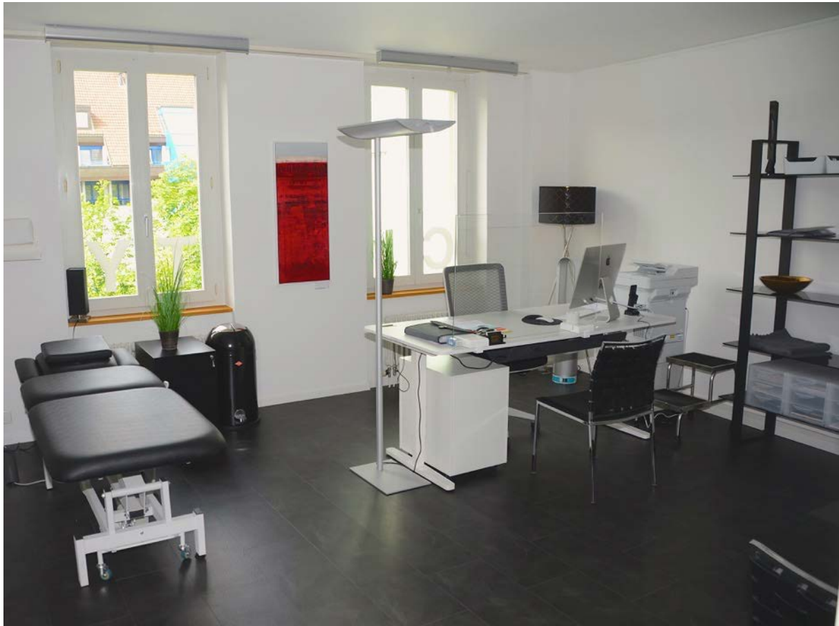
Behandlungszimmer 1 / Sekretariat